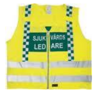
Tilsvare innsatsleder leder helse