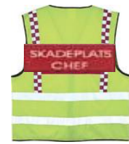
Tilsvare innsatsleder brann, leder brannvesenets arbeid på ulykkestedet