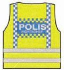
Tilsvare fagleder politi