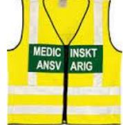
Tilsvare medisinsk leder helse.