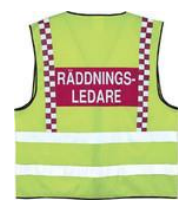
Tilsvare innsatsleder, ansvarer for samvirken og for all redningstjeneste på skadestedet