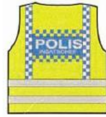
Tilsvarer fagleder politi