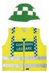
Tilsvarer innsatsleder helse