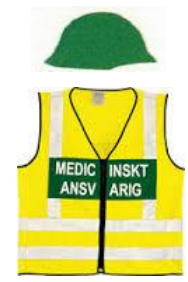
Tilsvarer medisinsk leder helse.