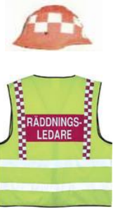
Tilsvarer innsatsleder, ansvar for samvirket og for all redningstjeneste på skadestedet