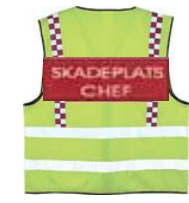
Tilsvarer innsatsleder brann, leder brannvesenets arbeid på ulykkestedet