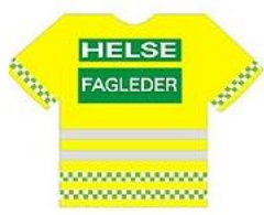
Motsvarar medicinskt ansvarig